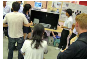
英語によるポスター発表